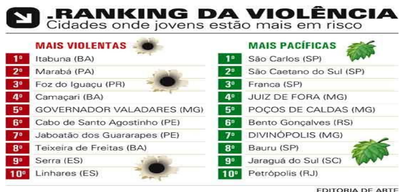
Figura 1 - Matéria publicada no Jornal Hoje em Dia.