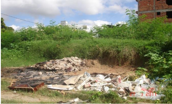
Fotografia 1 - Lotes sem muro, com lixo, com entulho e vegetação não cultivada superior a 1,00 metro e animal.