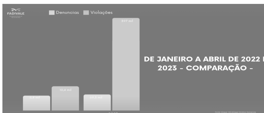
Gráfico 2 – Comparação do número total de violações e denúncias, 2022 e 2023, em milhares, jan.- abr. 2023.